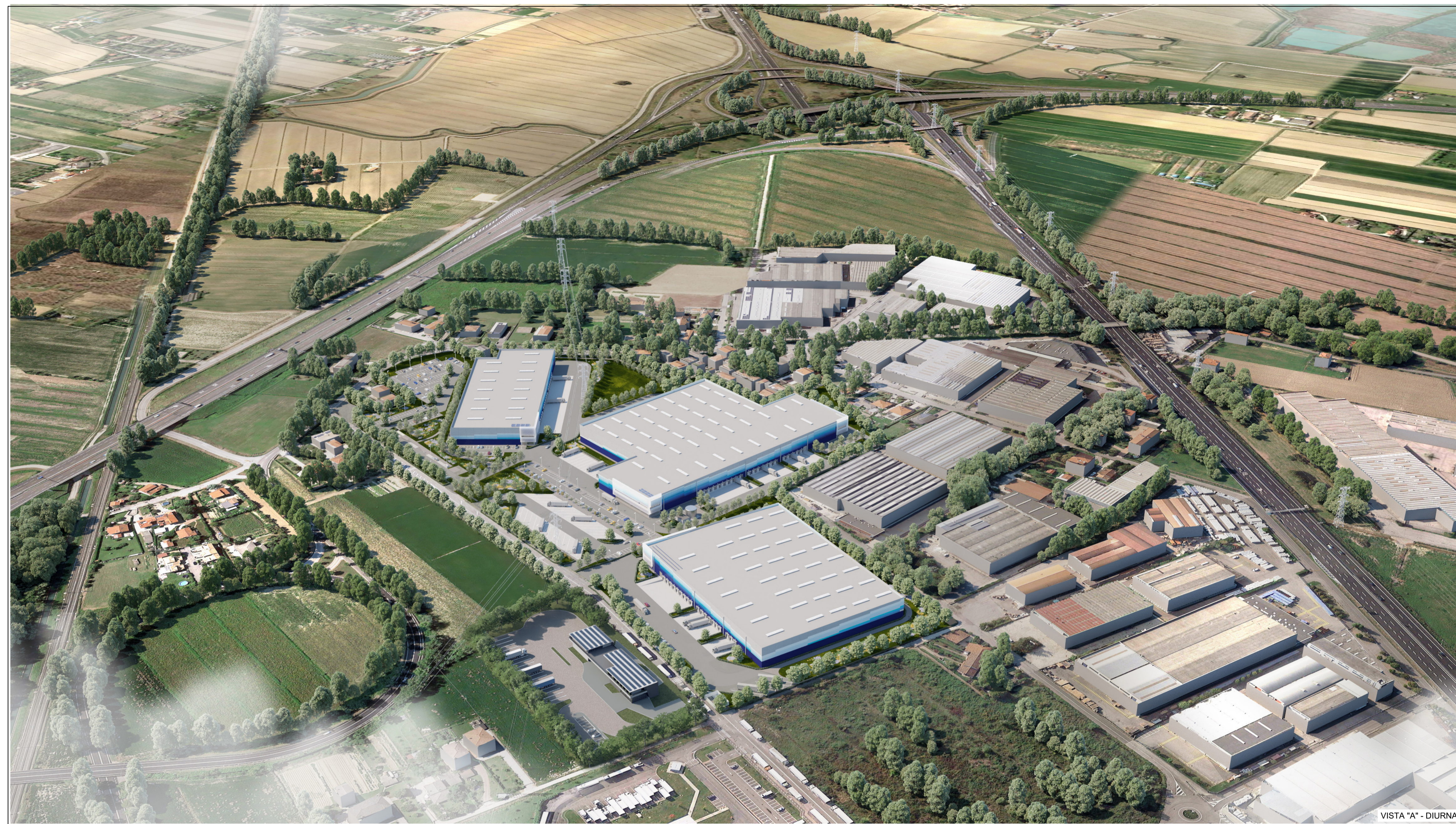
VISTA "A" - DIURNA