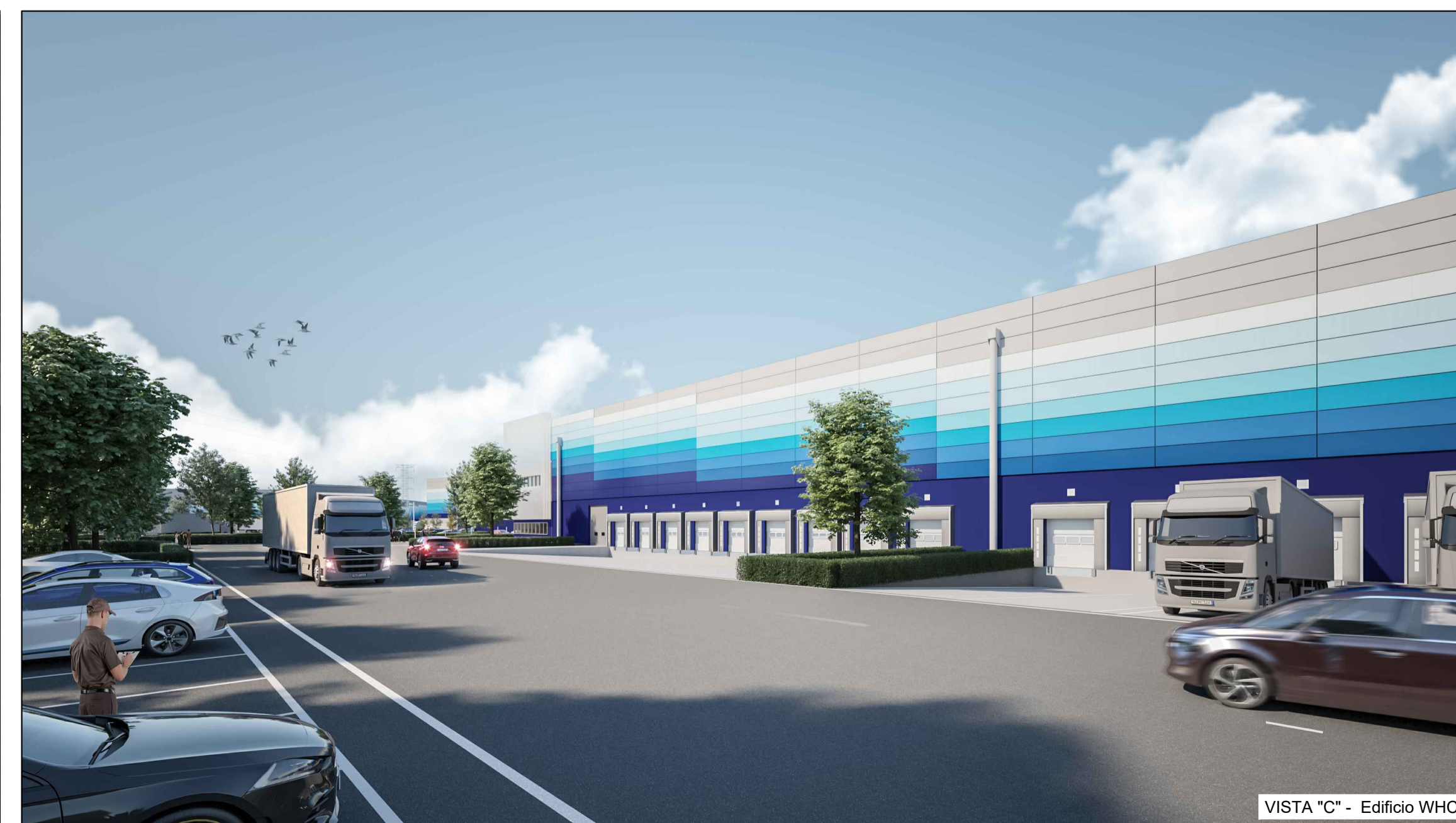
VISTA "C" - Edificio WHC